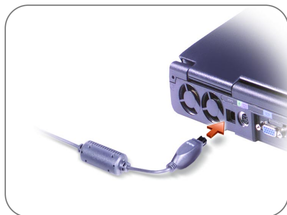
AC Adapter AC アダプタ 交流适配器 交流電變壓器